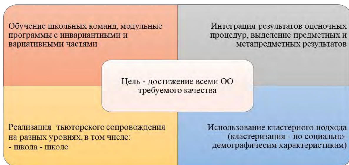
Рис.1. Основания для формирования плана-заказа на повышение квалификации педагогических кадров района

3) Реализация в образовательных программах района принципов обучения школьных команд и принципа модульного образования. Последний предполагает включение в ОП инвариантных модулей по наиболее актуальным направлениям, а также вариативных модулей, отражающих специфику конкретной школы, выявленную в результате интеграции результатов оценочных процедур.