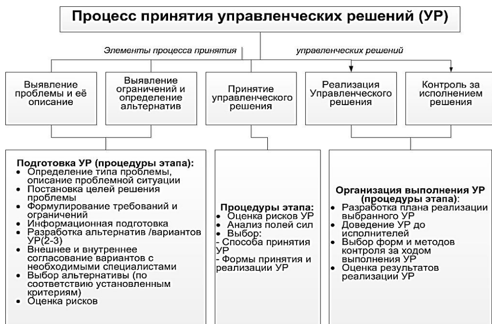
Рис. 1 Технология процесса принятия управленческих решений

Процесс принятия управленческих решений предполагает прохождение трех стадий: подготовки, принятия и реализации решений. Реализация каждой стадии имеет определенную технологию – совокупность последовательно применяемых приемов и способов достижения целей управленческой деятельности (рис. 1)